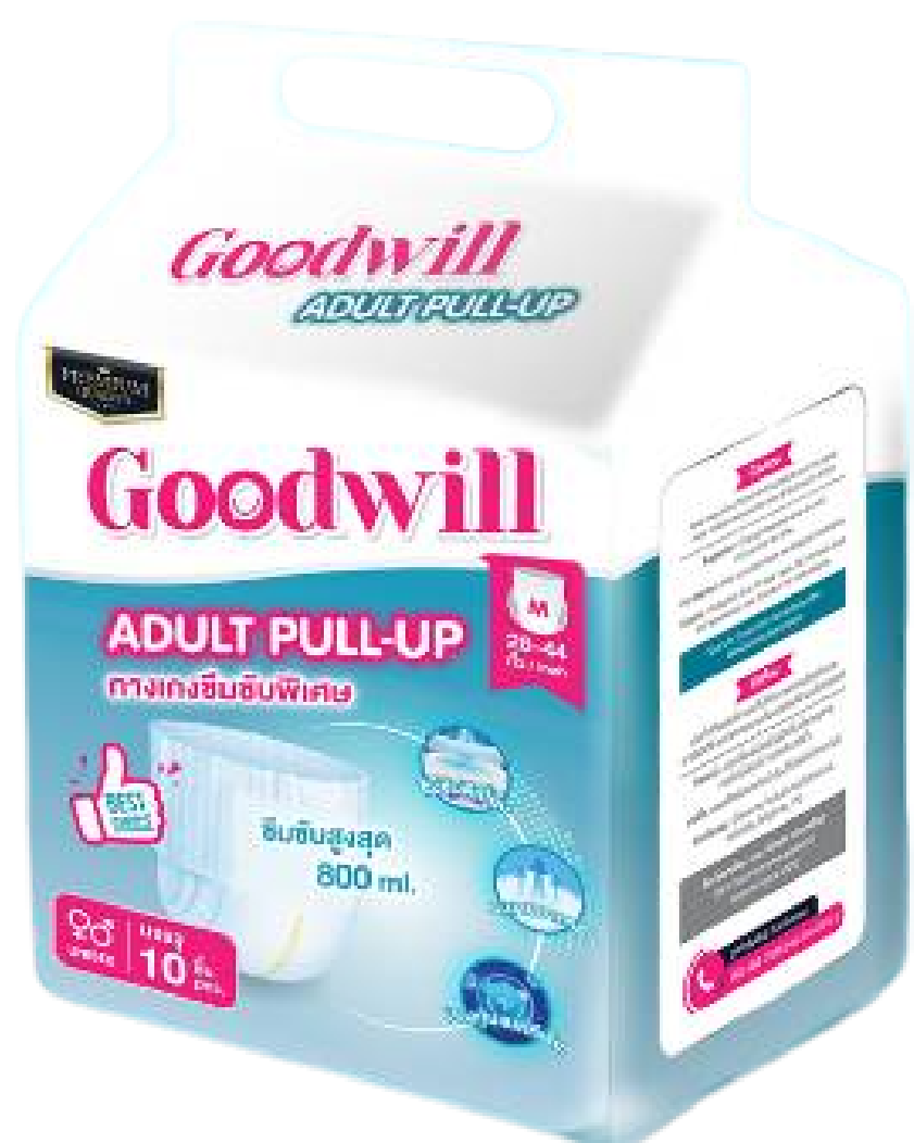
แพมเพิส ไซส์ M รอบเอว 28-44 นิ้ว