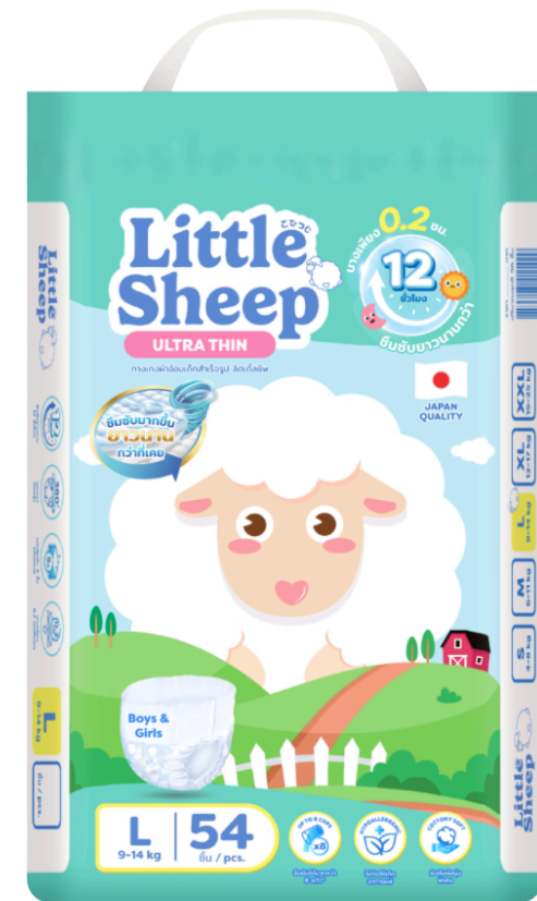
แพมเพิส ไชส์ L