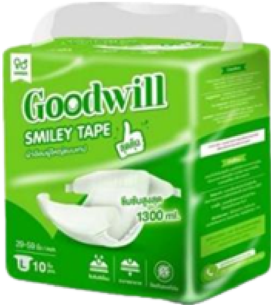
แพมเพิส ไซส์ L รอบเอว 29-59 นิ้ว