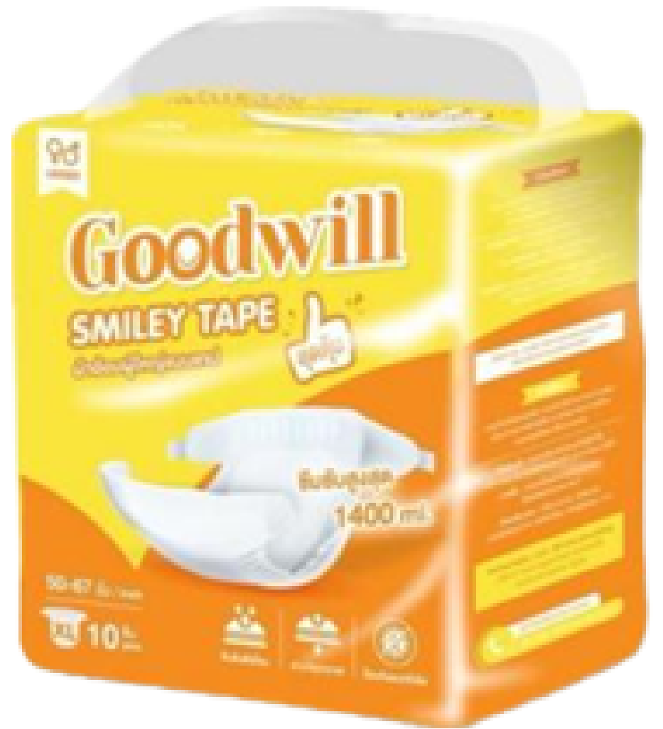
แพมเพิส ไซส์ XL รอบเอว 50-67 นิ้ว