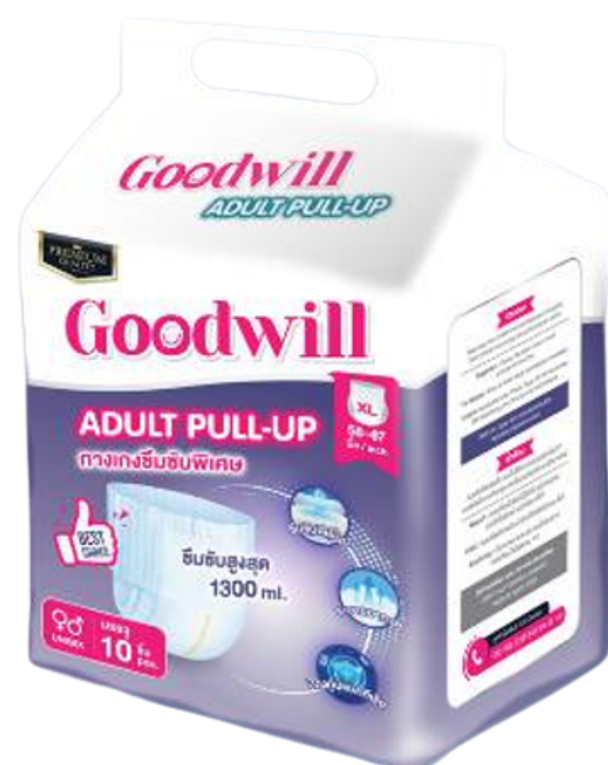
แพมเพิส ไซส์ XL รอบเอว 58-67 นิ้ว