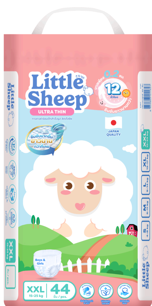
แพมเพิส ไชส์ XXL