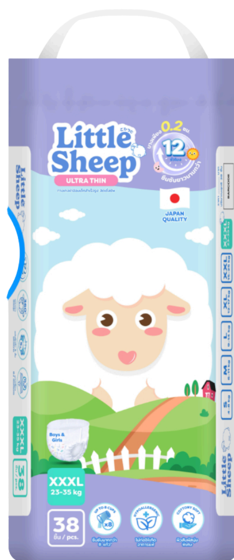
แพมเพิส ไชส์ XXXL