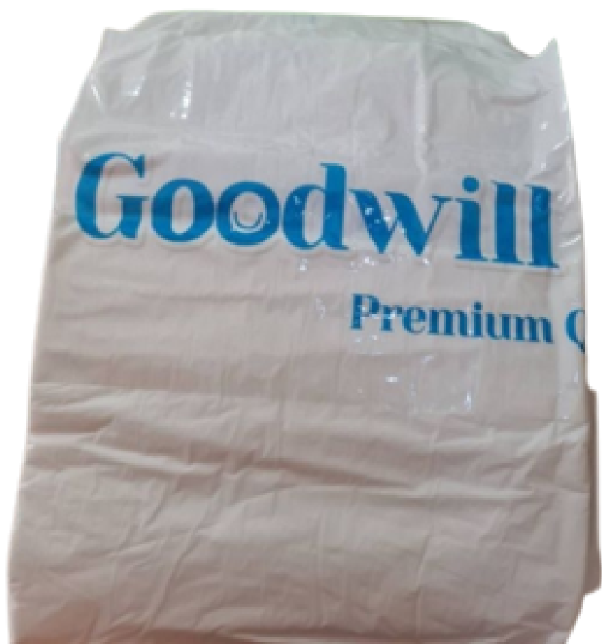
ตัวอย่างผ้าอ้อม