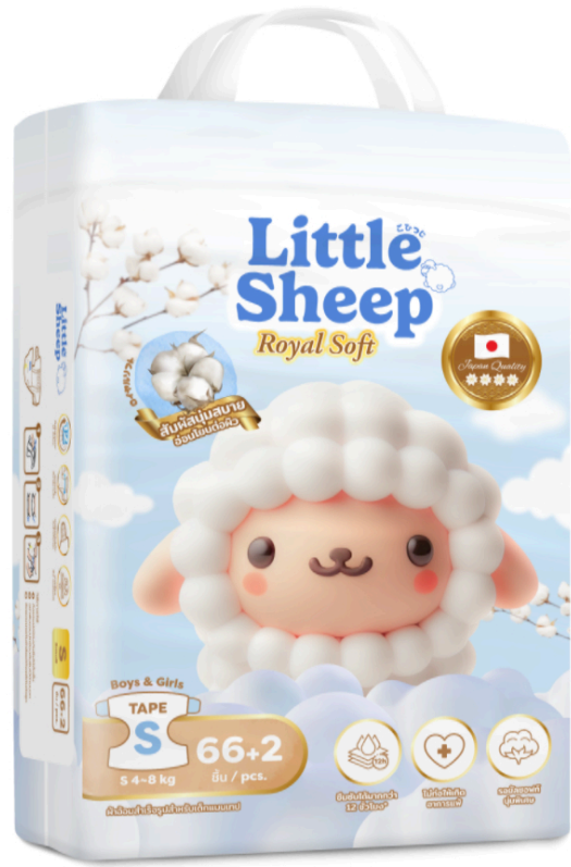
แพมเพิส ไชส์ S