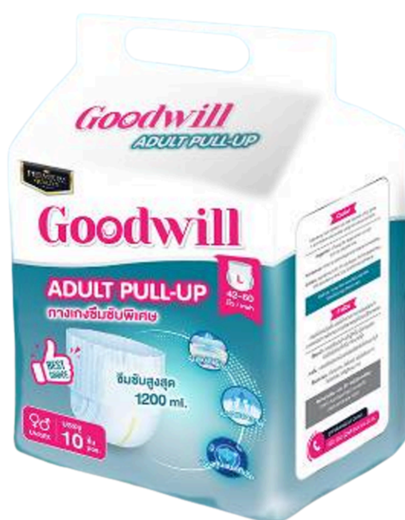
แพมเพิส ไซส์ L รอบเอว 46-60 นิ้ว