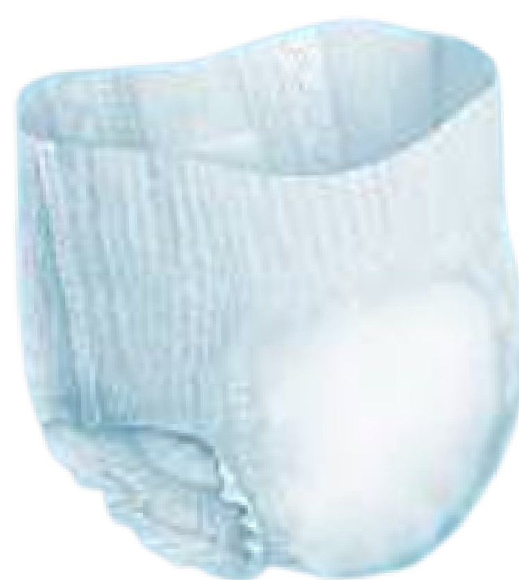
ตัวอย่างผ้าอ้อม