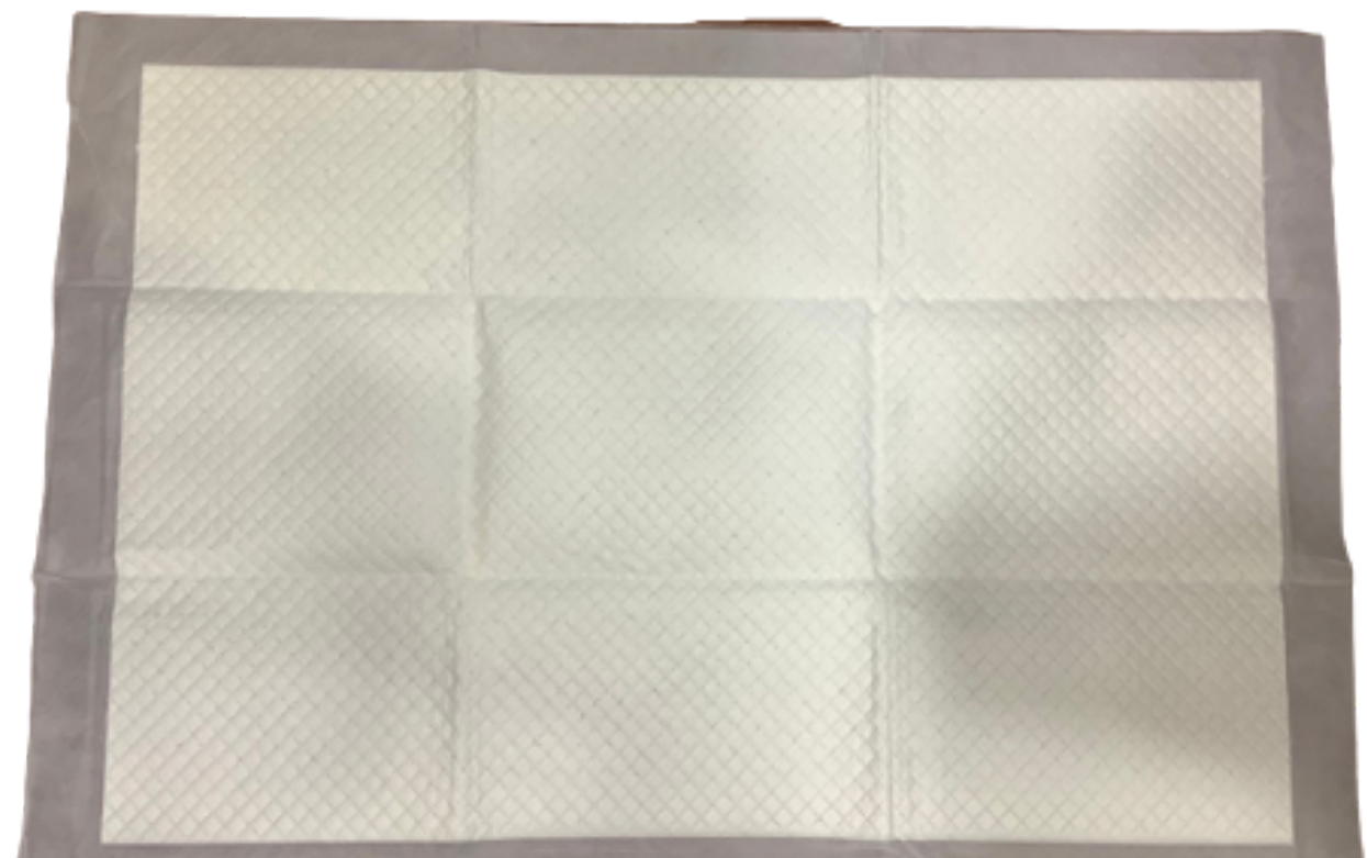
แผ่นรองซับ ราคา 6 บาท