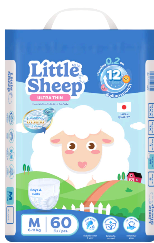
แพมเพิส ไชส์ M