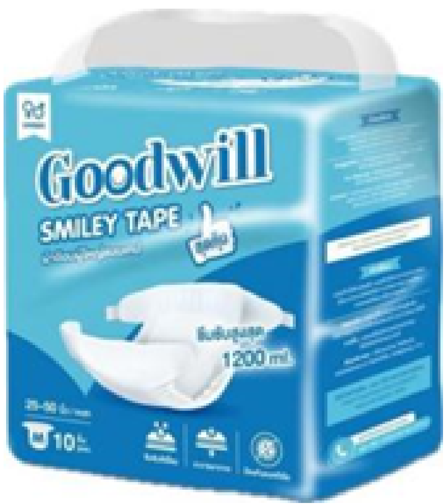
แพมเพิส ไซส์ M รอบเอว 25-50 นิ้ว