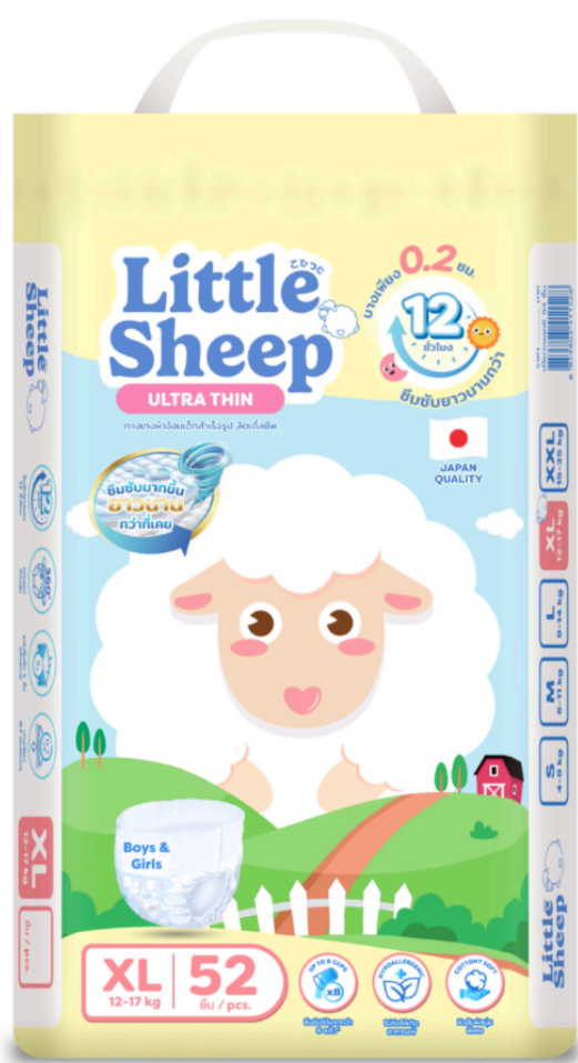
แพมเพิส ไชส์ XL