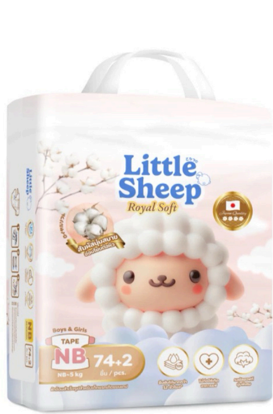
แพมเพิส ไชส์ NB-S